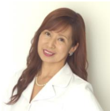
管理薬剤師・漢方カウンセラー

14：05 「漢方薬剤師の視点で見た、腸内環境と自閉症スペクトラムの大切な関係」